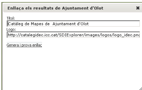
Il·lustració 2. Diàleg personalització vincle.

Alhora de generar aquest vincle és possible personalitzar el títol i logotip que es mostrarà a la pàgina resultant.